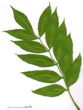
9 à 13 folioles autour d'un axe

I frutti di u frassu fermenu nant'à l'arburu long'à l'invernu. Sò samare è maturiscenu in caspe allungate.