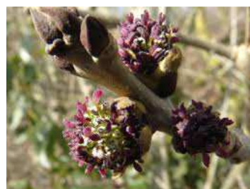
Fleurs et bourgeons