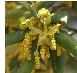
Fleurs males - fiori

UTILISATION : Le bois du chêne-liège est très dense et dur, difficile à travailler. Son écorce sert à la fabrication de bouchons et d'agglomérés isolants . Ses glands nourrissent les porcs et les sangliers à l'automne.