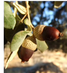
Fruits - Frutti

E fabriche di trasformazione di u sùvaru di Bonifaziu è Portivechju cunnoscenu un veru sviluppu da 1870 à 1940. Oghje, u sùvaru levatu ghjè mandatu in Sardegna.